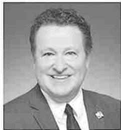
DONALD MARTEL Député de Nicolet-Bécancour