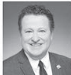
DONALD MARTEL Député de Nicolet-Béancour